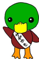
青森県警察特殊詐欺被害防止キャラクター「サギかまくん」