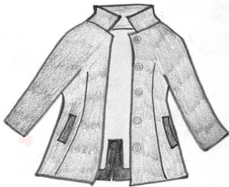
黒色ハーフコート