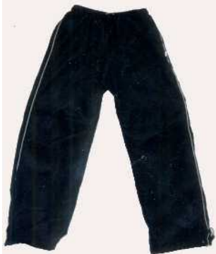
ウインドブレーカーのズボン