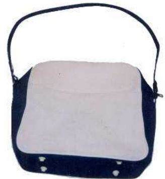
ショルダーバッグ

お問い合わせ先: 青森県警察本部鑑識課指紋第2係 代表電話: 017-723-4211